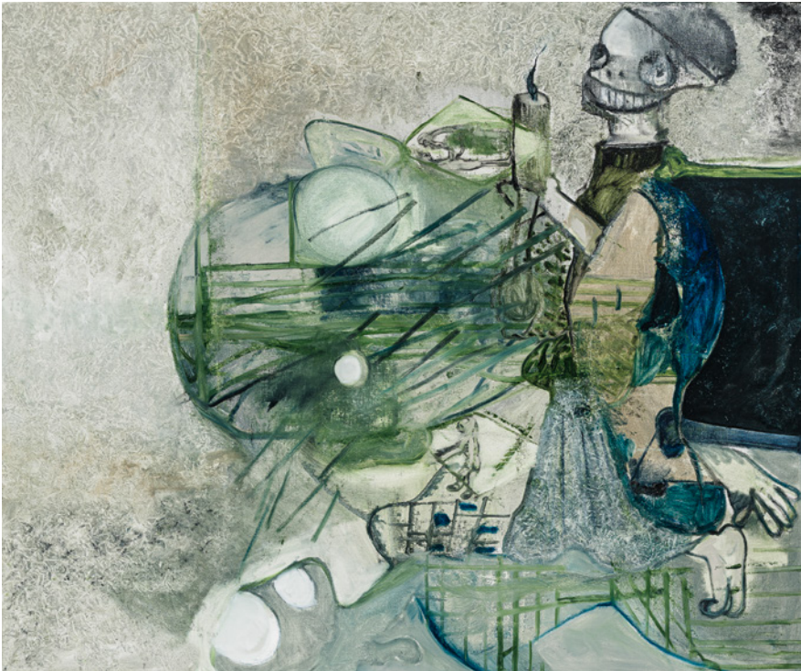
Tobias Pils, Geist , 2024, Öl auf Leinwand, 150 × 180 cm, Courtesy: Tobias Pils, Galerie Eva Presenhuber, Zürich / Wien und Galerie Gisela Capitain, Köln, © Tobias Pils, Foto: Jorit Aust