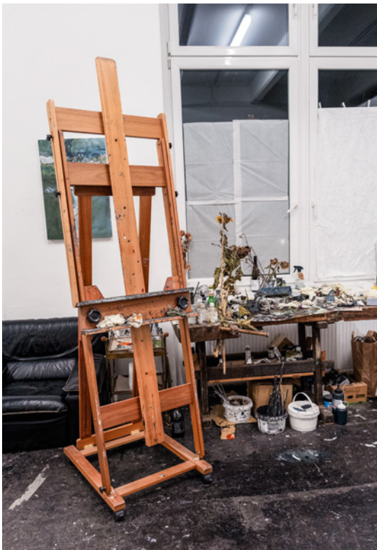
Atelier Tobias Pils, 2025, Wien, Foto: Julia Stellmann