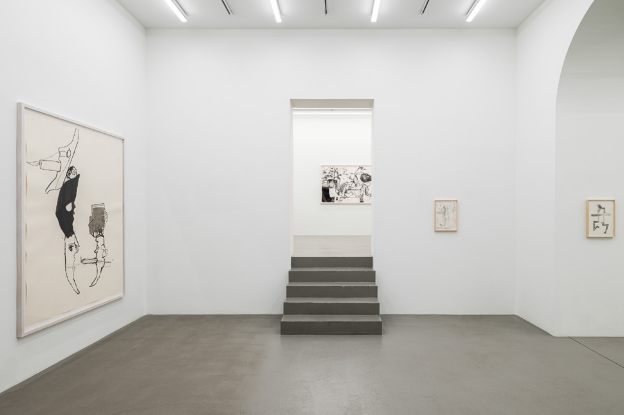
Installationsansicht, Tobias Pils. Blende zum Morgen / Fade to Morning. Zeichnungen / Drawings , Galerie Eva Presenhuber, Wien, 2025, Courtesy: der Künstler und Galerie Eva Presenhuber, Zürich / Wien, © Tobias Pils, Foto: Jorit Aust

Den Künstler hat nicht das Klassische, sondern das Genrehafte am Stillleben interessiert. Die Bilder zeigen alltägliche Dinge aus dem Atelier: ein Ikea-Glas, eine vertrocknete Rose, Kerzen. Für Pils schien das Stillleben nun konsequente Weiterentwicklung des Vorherigen zu sein: „Was ist ein Körper? Was ist innen? Was ist außen? Wie hart ist die Form?“. Es stellte Pils vor eine neue Herausforderung, bot zugleich etwas Existenzielles: „Es ist das, was wir sind oder was von uns übrig bleibt.“ Immer wieder tauchen jedoch Figuren oder Fragmente von Figuren in den Bildern auf, erwecken sie zum Leben. Die Stillleben sind plötzlich gar nicht mehr „still“, geraten in Bewegung. Selbst ein umgefallenes Glas oder eine ausgeblasene Kerze erzählen von menschlicher Existenz. In einem letzten Bild kulminieren „Geisterbilder“, „Körperbilder“ und Stillleben. Für Pils eine Art Auflösungsbild: „Als ich wusste, wie ich ein Stillleben malen könnte, hat es mich nicht mehr interessiert“. Er erläutert, dass ein Bild oder eine Familie von Bildern ihm selbst