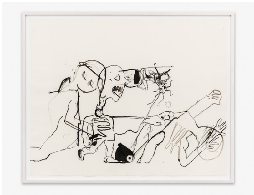
Tobias Pils, Untitled , 2025, Tusche auf Papier, 153 × 193 cm, Courtesy: der Künstler und Galerie Eva Presenhuber, Zürich / Wien, © Tobias Pils, Foto: Jorit Aust

Der Maler erzählt, dass jeder weitere Schritt zu viel gewesen wäre und eher eine Version oder Interpretation aus dem Bild gemacht hätte. Obwohl die Landschaft mit Kirche und Fluss gänzlich fehlt, scheint die leere Leinwand besonders passend für den Blindensturz zu sein. Dazu Pils: „Es bleibt ein Moment, in welchem die Koordinaten vorgegeben sind, aber der letzte Pinselstrich mehr oder weniger nicht bei mir liegt.“