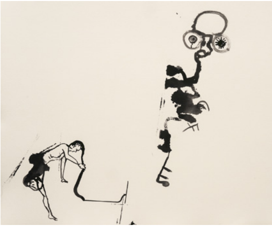
Tobias Pils, Untitled , 2023, Tinte auf Papier, 53,5 x 78 cm, Courtesy: Galerie Gisela Capitain, Köln, © Tobias Pils, Foto: Jorit Aust

„Wer bin ich im Anderen oder in einer Gruppe? Wie verhält sich mein Körper zu anderen Körpern?“