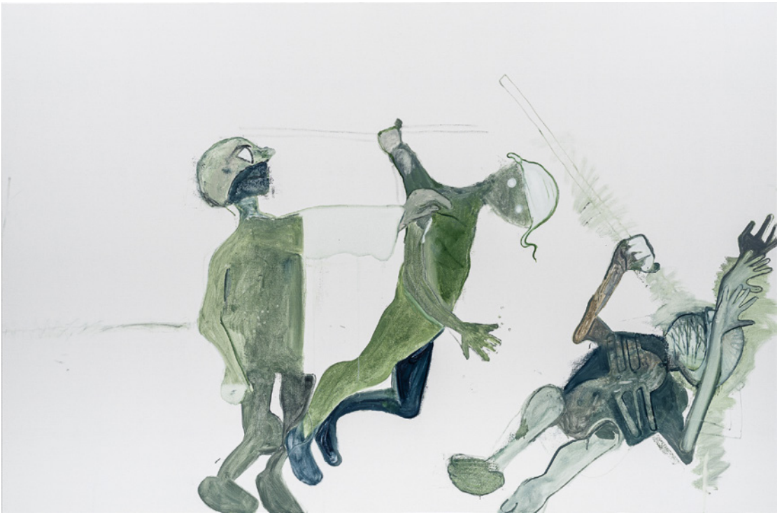
Tobias Pils, Blindensturz , 2024, Öl auf Leinwand, 202 × 305 cm, Courtesy: Tobias Pils, © Tobias Pils, Foto: Jorit Aust